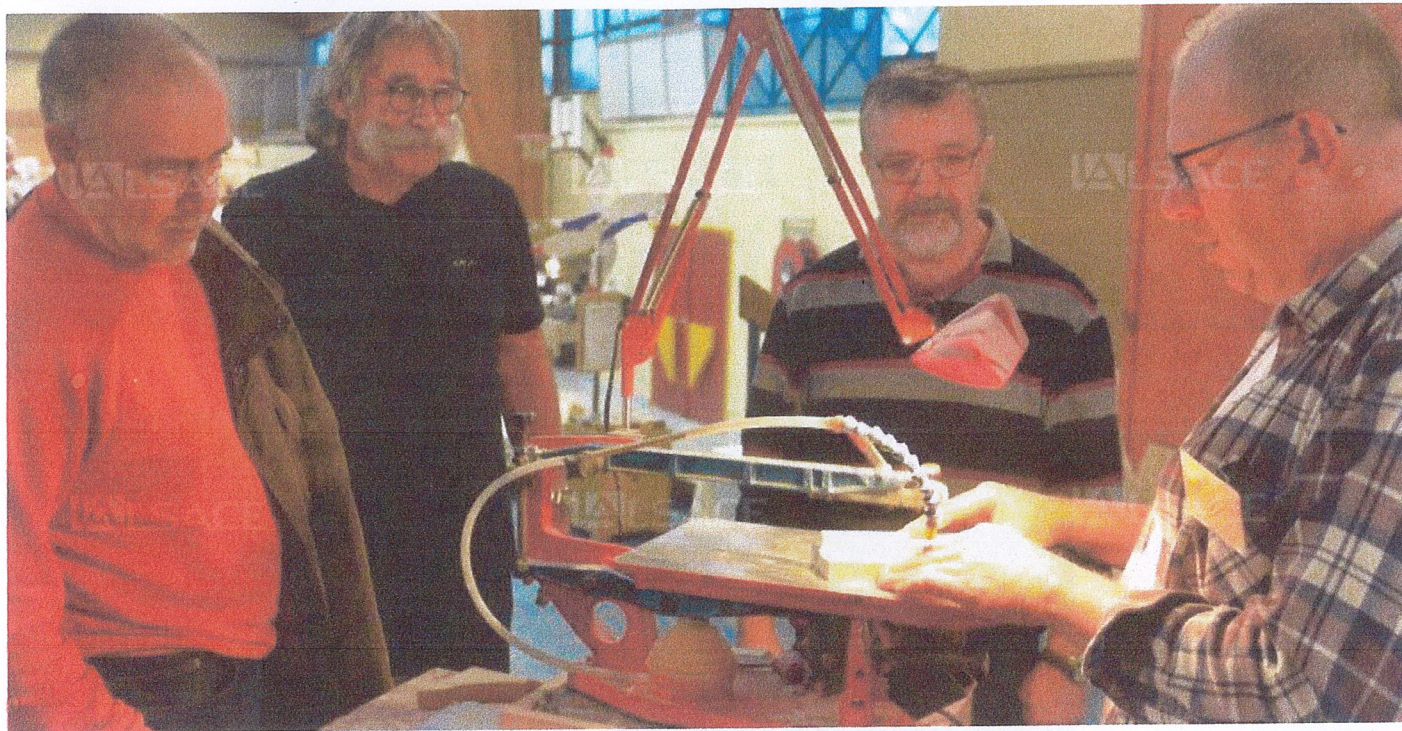
Démonstration de chantournage (Atelier Clu bois et fer de Staffelfelden). Photo DNA

Aujourd'hui 05:01 par Texte et photos : Paul Munch , actualisé Hier à 18:46 Vu 9 fois