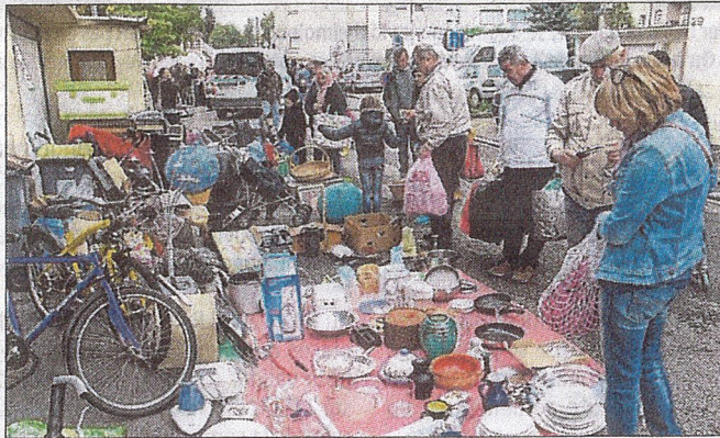
Les rues de Brunstatt étaient en fête, hier.