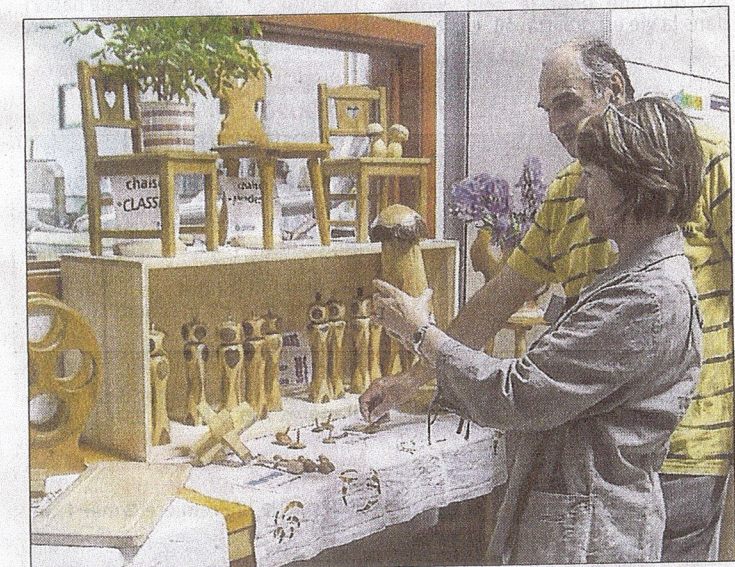
Quelques-unes des nombreuses créations en bois présentées lors de la journée portes ouvertes, au Centre de loisirs utiles (CLU) de Staffelfelden.