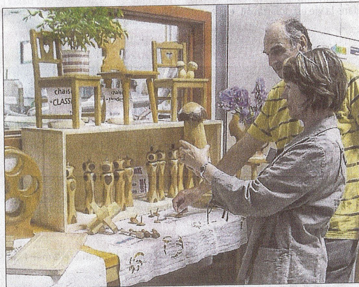
Quelques-unes des nombreuses créations en bois présentées lors de la journée portes ouvertes, au Centre de loisirs utiles (CLU) de Staffelfelden.