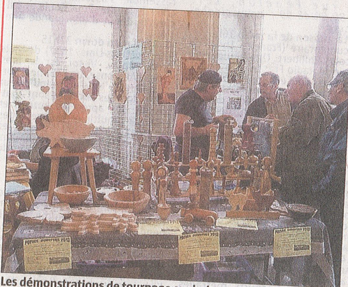
Les démonstrations de tournage sur bois suscitent beaucoup d'intérêt.

■ Y ALLER Aujourd'hui de 10 h à 12 h et de 14 h à 18 h à la Commanderie, 28 rue Zuber à Rixheim.