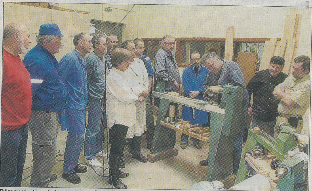
Démonstration de tournage par le maître ou comment s'initier et se perfectionner au maniement de la « gouge ».