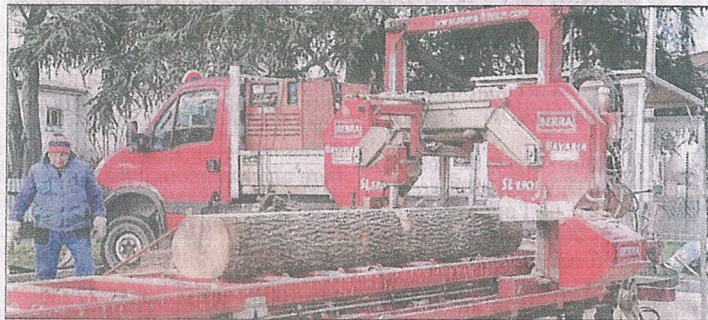
Une scie mobile est venue de Bruebach pour transformer les grumes.