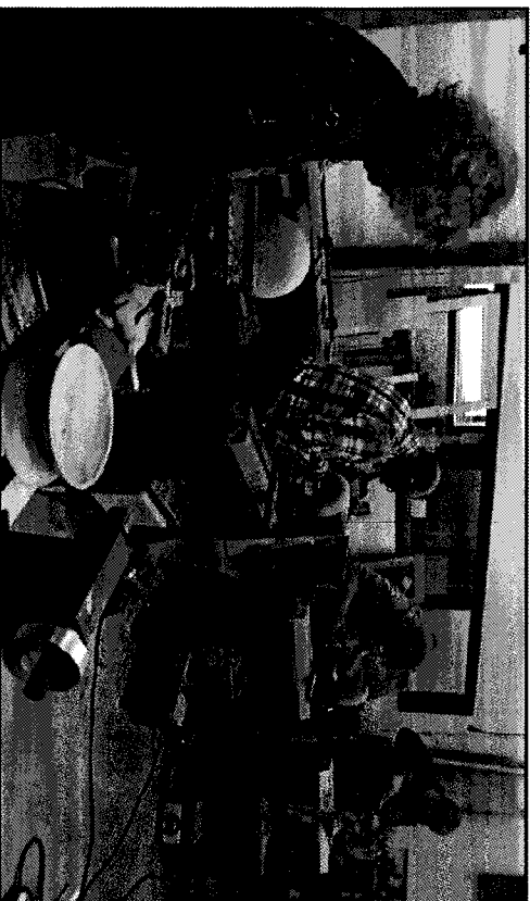
L'envie d'apprendre et la passion du bois des apprentis tourneurs faisaient plaisir à voir.

Apprendre à creuser le bois à l'aide de gouges, de bédanes à usiner et d'autres outils n'est pas facile pour des débutants. Il faut acquérir les premiers rudiments du métier, mais également l'assurance et le doigté pour ne pas se tromper. Une seule pression trop forte et il faut recommencer. Sont compris dans le sta-